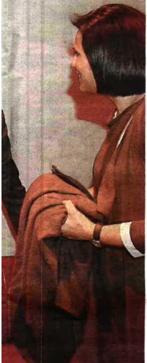
ika: "Foi o caminho mais fácil"