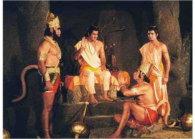
TV-serien Ramayana blev en succé under 1980-talet och gav skjuts åt hindunationalismen.