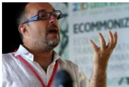
Giovanni Allegretti

"Pitanje budžeta je dugo vremena prodavano kao tehničko pitanje kojim se bave samo sposobne elite. Budžet je potrebno vratiti u polje politike jer to jest političko, a ne puko tehničko pitanje", tvrdi Giovanni Allegretti, teoretičar participativnog budžetiranja, uključivanja građana u donošenje odluka o tome kako će se trošiti javni novac. Brazilski grad Porto Alegre sinonim je za