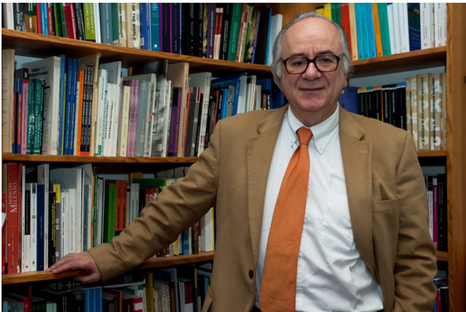
Boaventura Sousa Santos